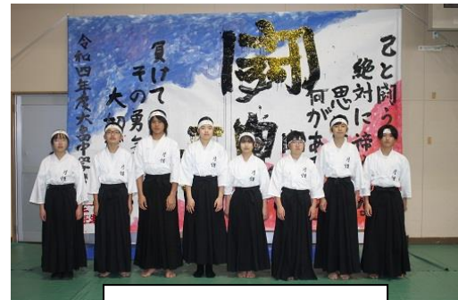
書き終えた「書」の前で