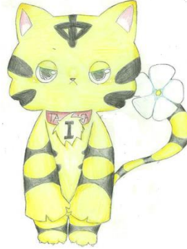
活力を届ける パワフルタイカー