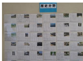
ふるさとコーナー