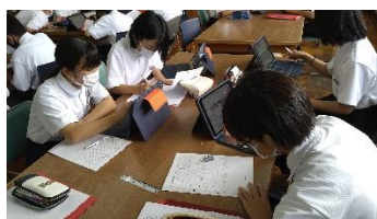
タブレットを使って事前学習