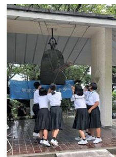
大津島回天記念館 平和の鐘を鳴らす