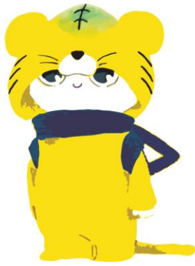
太華の森に住む 妖精タイカー