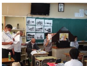
榎浜郷土史会の方による紙芝居