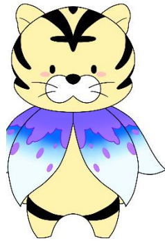
みんなのともだち たいかくん