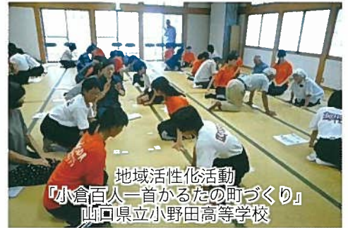
地域活性化活動 『小倉百人一首かるたの町づくり』 山口県立小野田高等学校

☆現職研修助成事業及び地域活性化活動助成事業において助成を行った活動は、活動概要をホームページに掲載しています。