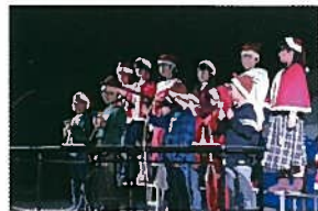
【3年生】ハンドベル演奏と歌