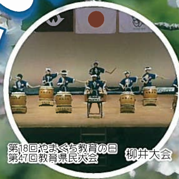
第18回やまぐち教育の日 第47回教育県民大会 柳井大会