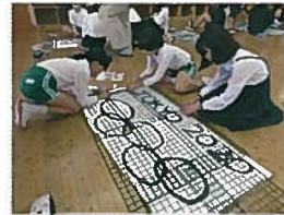
【6年生】イルミネ製作の様子