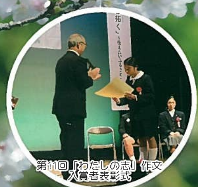
第11回「わたしの志」作文 入賞者表彰式