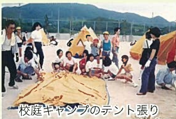
校庭キャンプのテント張り

教師や学校に社会の求めているものが昔と違うので、今では通用しないことばかりですが、新採三年間、私なりに子どもたちの居場所づくりに励みました。教室では、子どもたちが熱望する「饅頭こわい」の子ども版