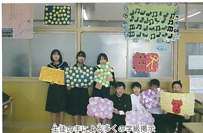
生徒の手による多くの学級掲示

また、新たな生徒たちと、新たな学級づくりがスタートする。生徒と共に、一人ひとりが安心できる場づくりに一層努めていきたい。