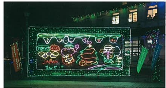
【6年生】イルミネ作品「ようこそ令和」(椿西小)