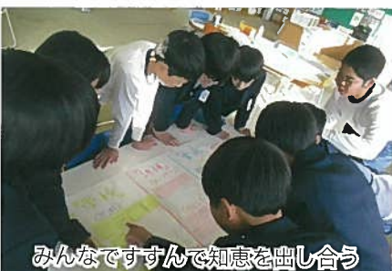
みんなですすんで知恵を出し合う

という私も、学級経営が依然と上手いきません。三月の「学級しまい」で、教室が感動で包まれるように、子どもたちが自信をもって次の学年・学校に向かえるように、学級経営の理論を学び続けたいです。