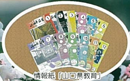
情報紙「山口県教育」