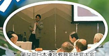
第71回日本連合教育会研究大会 滋賀大会(分科会発表)