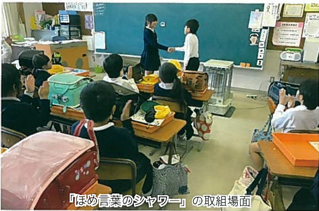
「ほめ言葉のシャワー」の取組場面

子どもの育ちに凹凸があるのは当たり前。それをならして、整えようとするのではなく、個性を活かし、そのユニークさを認め合える学級にしたいと思います。発言だけではなく、行為や態度面にも目を向け、その子のもつよさに焦点を当て、価値付けたい