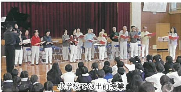
小学校での出前授業