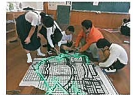
【6年生】イルミネ製作の様子