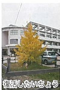
復活したいちよう

四十数年前の先輩方からのメッセージが今日も私たち子どもたちに届いています。中庭にある石碑です。「草のようにたくましく 雲のようにおおらかに 輪となるう 光となるう」と刻まれています。たくましく、おおらかに、みんなが手をとり合って、笑顔いっぱい白石小学校でありたいと思えます。