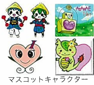
マスケットキャラクター

最も印象に残っていることの一つは、生徒により考案されたマスケットキャラクター「つながりん」の誕生である。CSの主役はやはり生徒であることを改めて感じた瞬間だった。また、これらの取組を支える教職員も