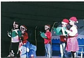
【3年生】クリスマスの歌