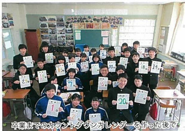
卒業までのカウントダウンカレンダーを作った後で

しているのが学級通信です。学級経営の方針、クラスの現状を生徒・保護者に「見える化」し、理解・協力を得られるようにしています。生徒の活動に対する価値付けとしても大きな役割を担い、感想や集合写真を掲載することで、クラスへの帰属意識も高めることができます。 生徒たちが自分自身をしつかりと見つめ、目的や目標をもち、今何をすべきかを考え、先を見通して行動できる一年間になるよう、今年度も頑張ります。