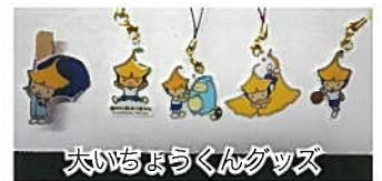
大いちようくんグッズ