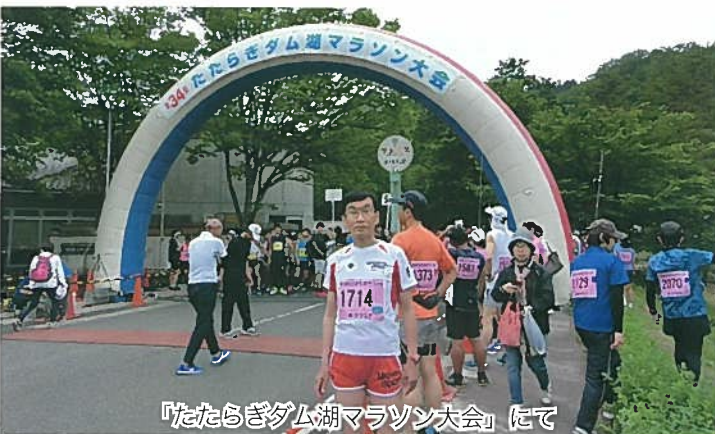
「たたらぎダム湖マラソン大会」にて

知人からは、そう言葉をかけられることもあります。長い距離を走るのは好事家のすることなのかもしれま