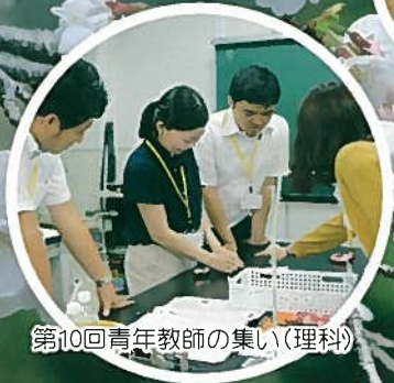
第10回青年教師の集い(理科)